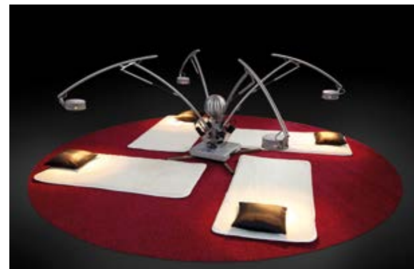
Das Imaginarium, die Installation der Tiroler Aussteller auf der Art Beijing 2013. Beim Imaginarium verschmelzen Künstler, Kunstwerk und Betrachter in einem einzigen Augenblick.

kuliert, trifft verschlüsselte Aussagen, spiegelt Seelenleben und Individualität der Künstler wider. Ähnlich wie in vielen europäischen Städten etablierte sich die Szene zunächst in aufgelassenen Fabrikgebäuden. In Peking heißt diese schlicht „798 Art District“. In der Fabrik 798 wurden früher Elektrogeräte erzeugt; heute finden sich hier mehr als 100 Galerien, Ateliers und Künstlercafés.